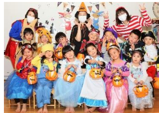
ハロウィンパーティ