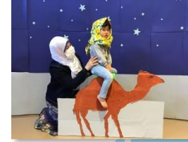
エジプトのアミラ先生と一緒にらくだづくりを楽しみました。