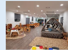
Croydon Park Cottage

オーストラリアでの保育園運営を通して、主体性・社会性・コミュニケーション能力の育みに注力した優れた保育を学び、日本の園でも一部を取り入れています。職員の研修先としても活用しており、今後は親子留学の受け入れ施設としても検討しています。