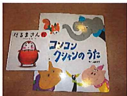
～6月の未就園の様子～