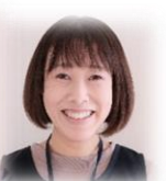
ななみ まゆみ ななみ まゆみ