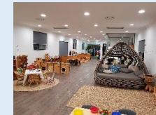
Croydon Park Cottage

オーストラリアでの保育園運営を通して、主体性・社会性・コミュニケーション能力の育みに注力した優れた保育を学び、日本の園でも一部を取り入れています。職員の研修先としても活用しており、今後は親子留学の受け入れ施設としても検討しています。