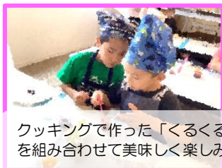
クッキングで作った「くるくるロールサンド」は大好評！素材を組み合わせると美味しく楽しめました！