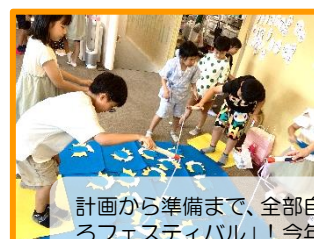
計画から準備まで、全部自分たちの力で行った「そらいろフェスティバル」！今年は景品なども作って、パワーアップしていました。