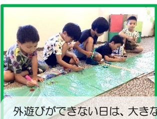
外遊びができない日は、大きなビニールや段ボールに思いっきりお絵かき！七夕飾りも作って、夏らしい室内で過ごすことができました♪