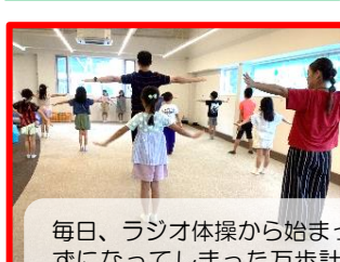
毎日、ラジオ体操から始まった今年の夏休み。行方知らずになってしまった万歩計を探る探偵チームも現れ、日々活躍してくれました！