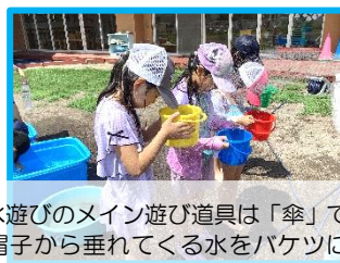
今年の水遊びのメイン遊び道具は「傘」でした！帽子から垂れてくる水をバケツにためる修行をする子ども…☆みんな、遊び上手！