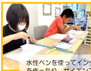
水性ペンを使ってインクの色を観察したり、不沈子を作ったり、サイエンス要素も体験♪