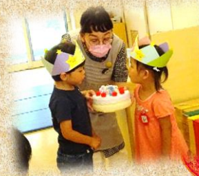
お誕生日のお祝い