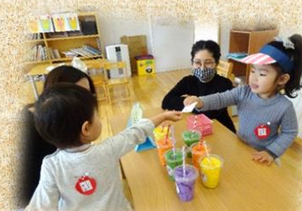
おみせやさんごっこ