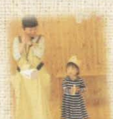
お誕生日のお祝い