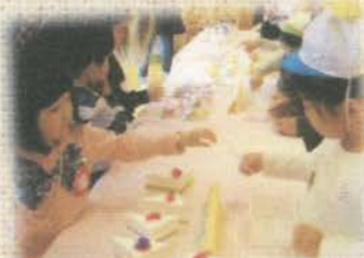
おみせやさんごっこ