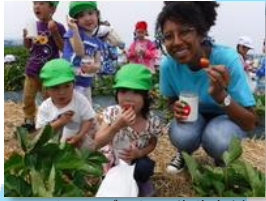
スペインのデシレー先生とはいちご狩りを楽しみました。