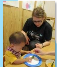
ポーランドのアガタ先生と一緒にポーランド食器の伝統に触れました。