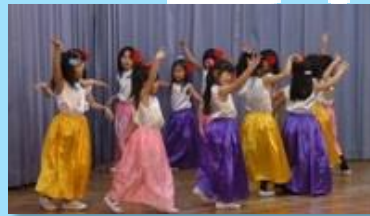
スペインから発祥のフラメンコ。保護者の方との交流会の他、園児たちも真剣に取り組みました。