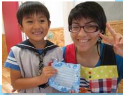
エクアドルのターニャ先生へ。想いをこめて、英語のお手紙のプレゼント。