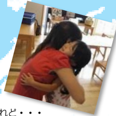
お別れは寂しいけれど・・・ 「また会おうね」スペインのヨリ先生との約束。