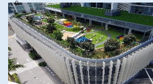
BlueBerries Childcare (ブルーベリースチャイルドケア / ゴールドコースト)

オーストラリアでの保育園運営を通して、主体性・社会性・コミュニケーション能力の育みに注力した優れた保育を学び、日本の園でも一部を取り入れています。職員の研修先としても活用しており、今後は親子留学の受け入れ施設としても検討しています